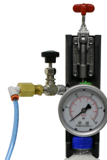
Boquilla del AGS-7000

La boquilla del AGS-7000 tiene un mecanismo tipo clamp para perforar la botella, además cuenta con una válvula de alivio y un manómetro (digital o analógico) para la medición de presión.